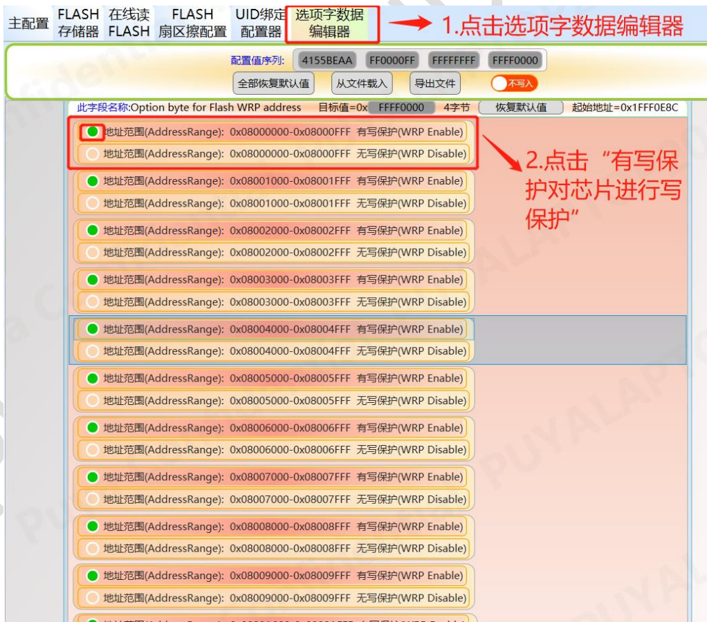
图 3-1 轩微操作 Option 写保护