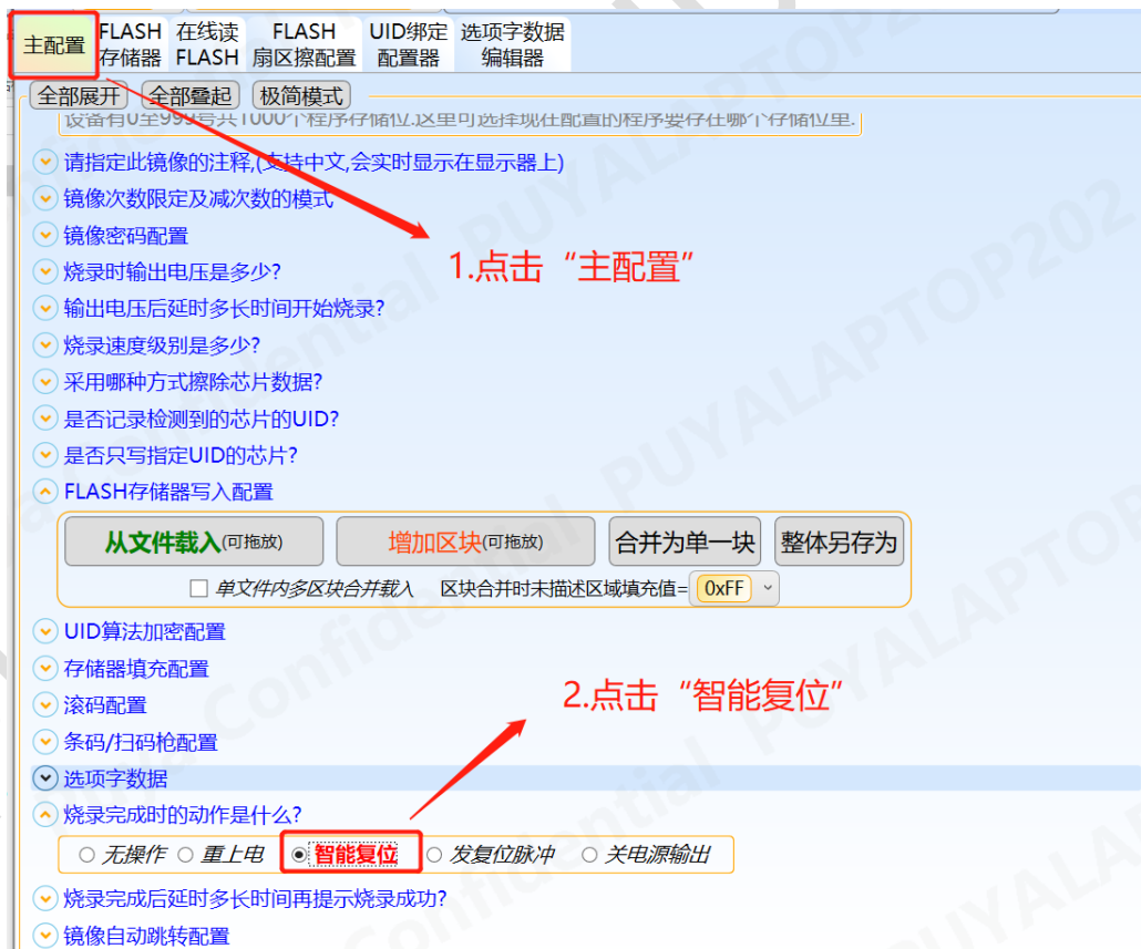
图 3-3 轩微操作 “智能复位”